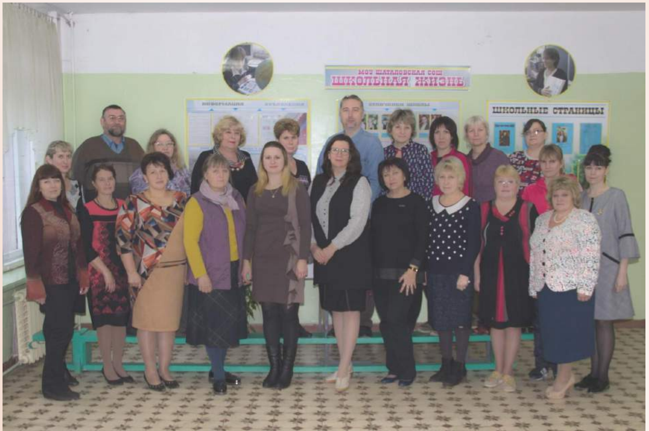
Гордость школы творчески работающий педагогический коллектив