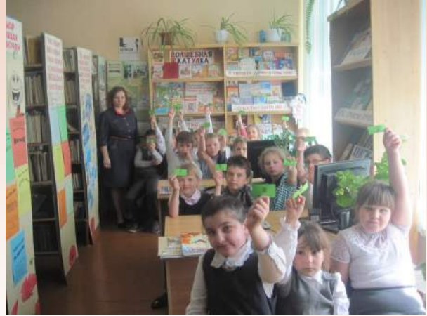
Информационно-библиотечный центр школы