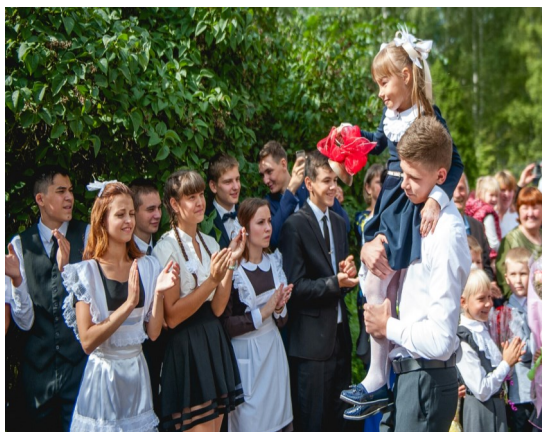
Первый звонок 2016-2017 учебного года