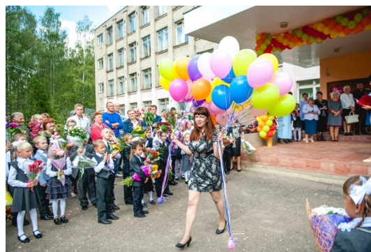
Воздушные шарики— подарок первоклассникам