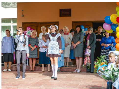
Музыкальное поздравление от девочек— старшекласс- ниц.