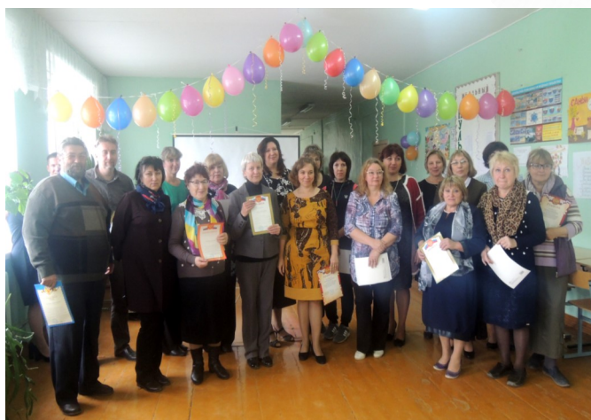
В заключении концерта состоялось чествование ветеранов педагогического труда