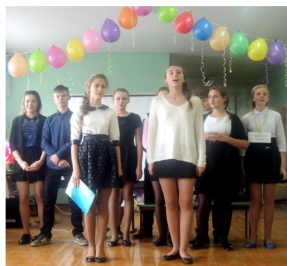
Ученики 8 классов исполнили песню «Учитель мой»