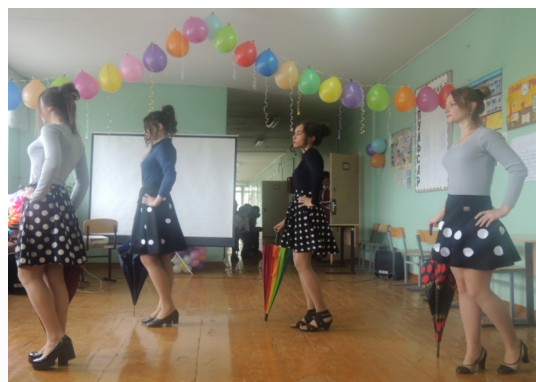
Грациозно и артистично девочки 10 класса исполнили танец с зонтиками